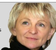
Figure de l'économie sociale et solidaire, depuis 20 ans, elle milite pour la coopération comme outil d'avenir, moderne, adapté à l'économie et aux femmes et hommes d'aujourd'hui. En 2016 elle a reçu la légion d'Honneur pour son travail en faveur de la coopération et l'élaboration de la loi économie sociale et solidaire reconnaissant les coopératives d'activités et d'emploi, et en 2019 elle est lauréate des Trophées de l'entrepreneuriat au féminin.

Fondatrice, Directrice et Gérante des coopératives d'entrepreneurs Régate et Régabât